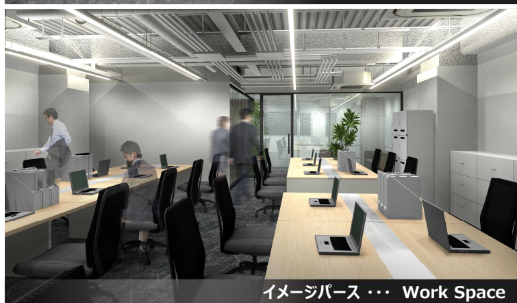
イメージパース … Work Space