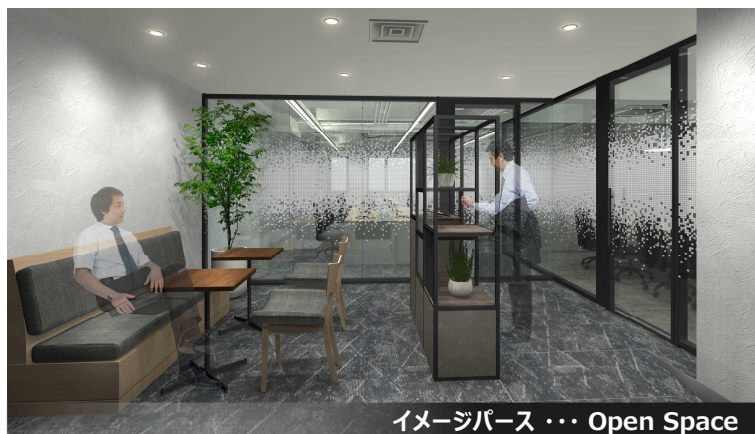
イメージパース … Open Space