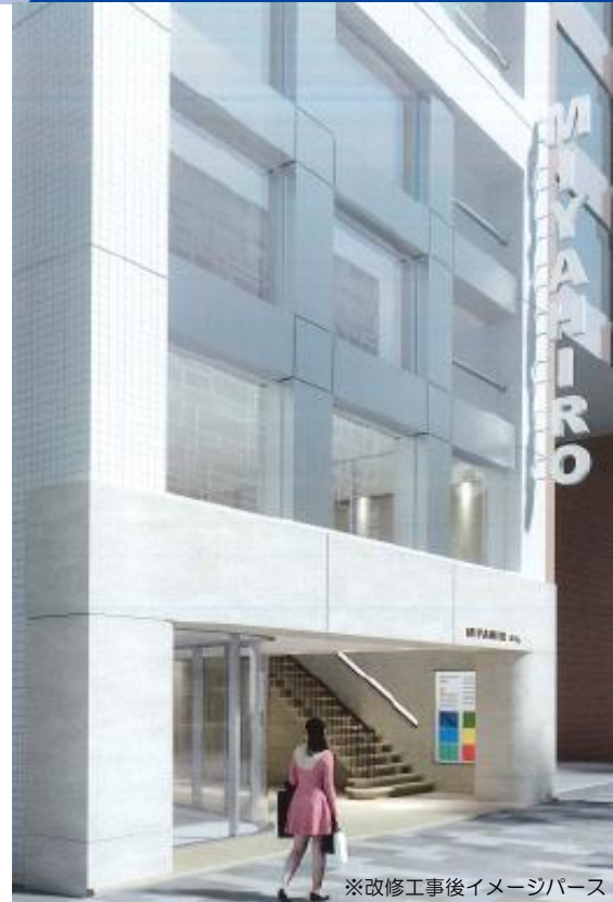
※改修工事後イメージパース