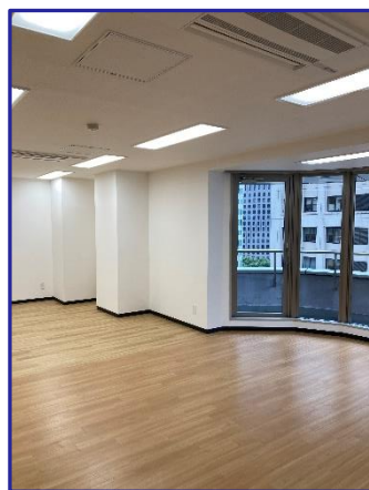
※室内イメージ写真