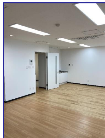
※室内イメージ写真