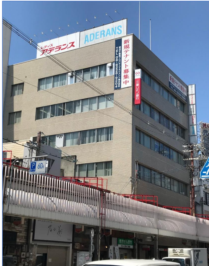
【 外 観 】