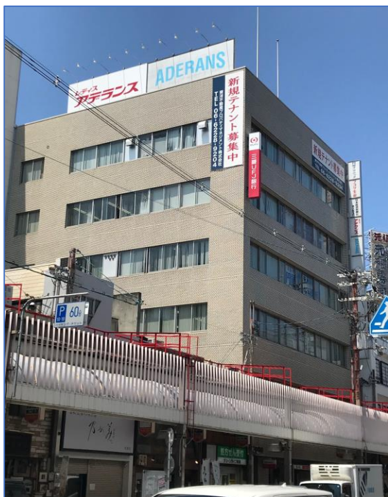
【 外 観 】