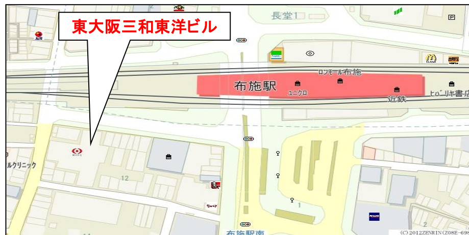
【 地 図 】